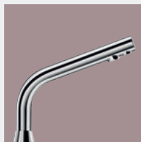
Kranen voor Publieke Ruimten