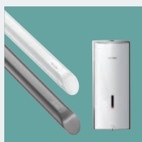
Toegankelijkheid en Autonomie Hygiëne accessoires