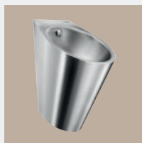
RVS Sanitaire Toestellen