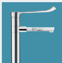
Kranen voor Zorginstellingen en Woonzorgcentra