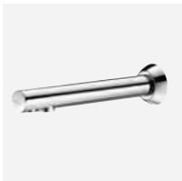
BINOPTIC - L.200 mm