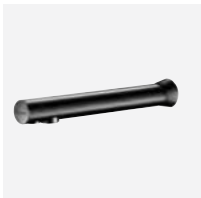
BLACK BINOPTIC TC - L.205 mm