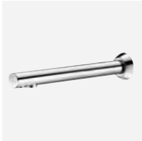
BINOPTIC, lang model - L.252 mm

Nieuwe lengte voor nieuwe mogelijkheden !