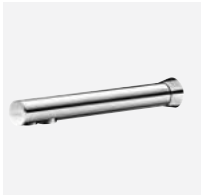
BINOPTIC TC - L.205 mm