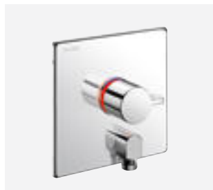
Thermostatische douchemengkraan voor inbouw Ref. DELABIE: H9633BEL + H96CBOX

Onderstaande afbeeldingen zijn beschikbaar op de website delabiebelux.com , rubriek Pers