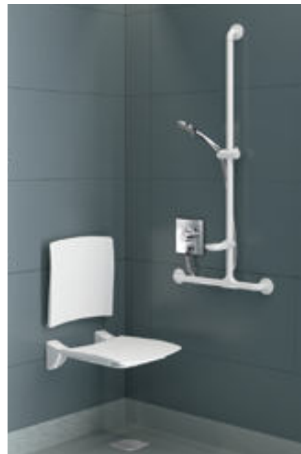
Installatievoorbeeld met H9633BEL mengkraan Ref. DELABIE: DOUCHE ACCOMMODATIE H9633BEL