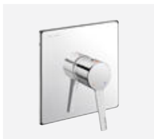
Mechanische douchemengkraan voor inbouw Ref. DELABIE: 2541 + 254BOX