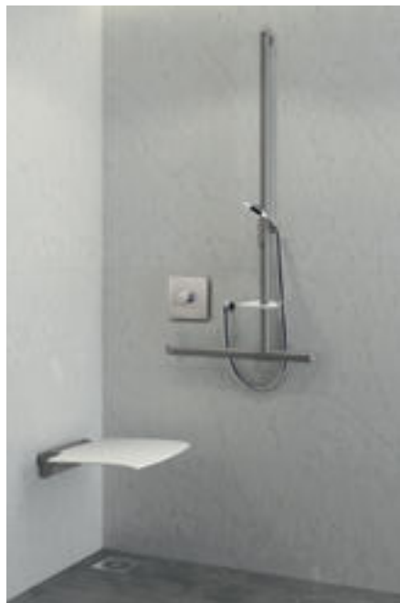
Installatievoorbeeld met H9631BEL mengkraan Ref. DELABIE: DOUCHE H9631BEL