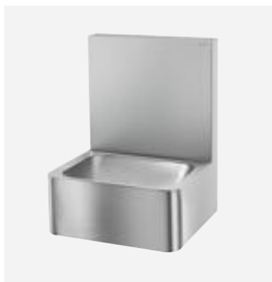
Hygiënisch handwasbakje in rvs DELABIE ref.: 188000

Afbeeldingen zijn beschikbaar op de website delabiebenelux.com , rubriek Pers