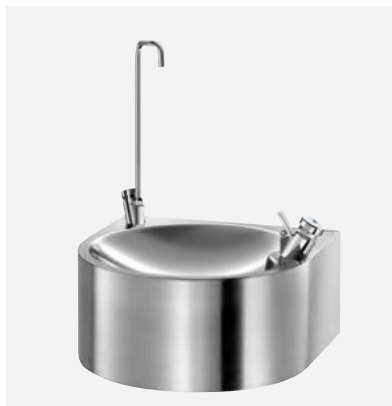
Ref. DELABIE: 180820

Afbeeldingen zijn beschikbaar op de website delabiebelux.com , rubriek Pers