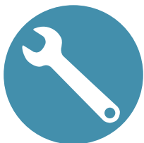
Gemakkelijk te installeren