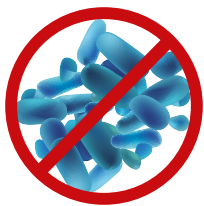
Hygiëne Geen stilstaand water