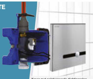
Kraag met geïntegreerde dichtingsring