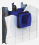
RAILS VOOR GIPSPLAAT