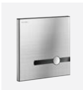
TEMPOMATIC dubbele bediening DELABIE ref.: 464SBOX-464000 of 464PBOX-464006

Onderstaande afbeeldingen zijn beschikbaar op de website delabiebelux.com , rubriek Pers