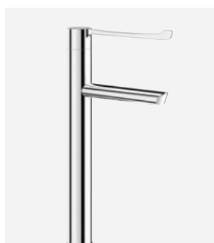
Bec fixe H.300 L.160 Réf. DELABIE : 2665T3BEL