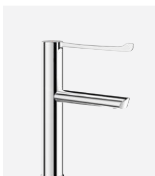
Bec fixe H.160 L.160 Réf. DELABIE : 2665T1BEL