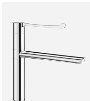
Bec orientable H.160 L.250 Réf. DELABIE : 2664T2BEL

Illustrations disponibles sur notre site internet delabiebelux.com , rubrique Presse