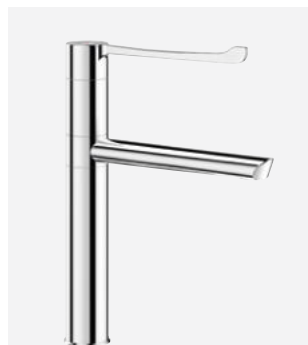
Bec orientable H.200 L.200 Réf. DELABIE : 2664T5BEL