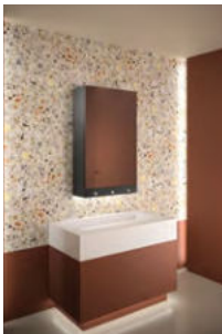
Installation en solo – Armoire 4 en 1