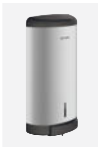
Distributeur de savon spécial douche