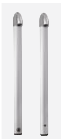
Forme un DUO design avec les colonnes de douche SPORTING 2 temporisées ou électroniques