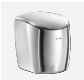
Inox poli-satiné Réf. DELABIE : 510622S