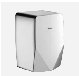
Inox poli-satiné Réf. DELABIE : 510625S