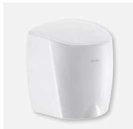
Epoxy blanc Réf. DELABIE : 510622W