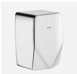
Inox poli-brillant Réf. DELABIE : 510625P