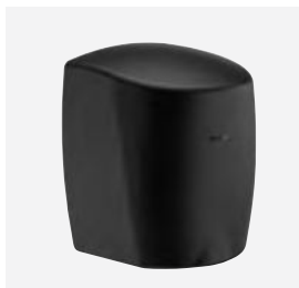
Epoxy noir mat Réf. DELABIE : 510622BK