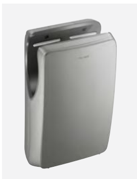
Anthracite métallisé Réf. DELABIE : 510624C