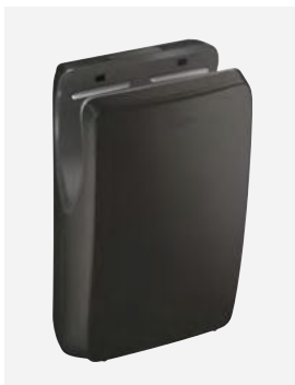
Noir mat Réf. DELABIE : 510624B