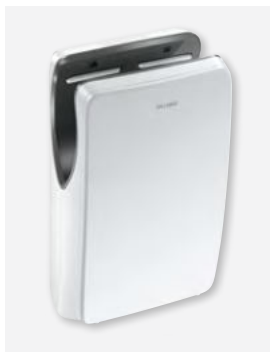
Blanc mat Réf. DELABIE : 510624W