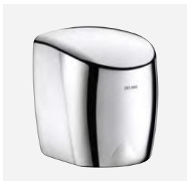
Inox poli-brillant Réf. DELABIE : 510622