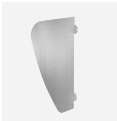
Séparateur urinoir AZA Réf. DELABIE : 100620

Illustrations disponibles sur notre site internet delabiebenelux.com , rubrique Presse