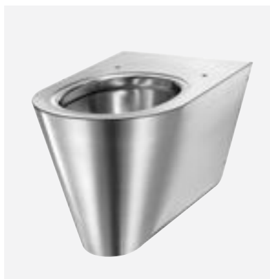
WC suspendu design Inox S21 S Réf. DELABIE : 110310

Illustrations disponibles sur notre site internet delabiebenelux.com , rubrique Presse