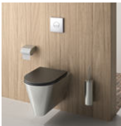
Exemple d'installation WC suspendu design Inox S21 S